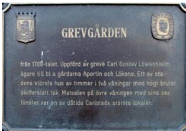
Den platta av metall som satts upp på Grevgårdens vägg genom Karlstads kommun och Carlstads-Gillet

Under åren har Grevgården genomgått ett flertal renoveringar och ombyggnationer. År 1927 fick gården den ungefärliga exteriören den har idag. Gården är nu återigen rödmålad, vilket var ursprungsfärgen, under ett antal år var den nämligen vit. Än idag är också det uthus som 1879 byggdes av landssekreteraren Varenius bevarat. Både uthuset, kallat Stallet, och Grevgården består idag av hyresrätter i olika storlekar.