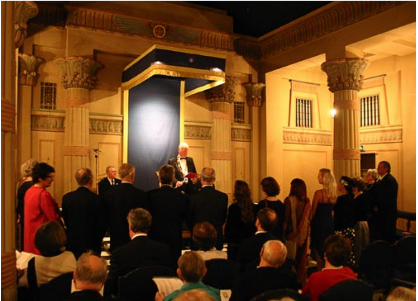
Invigningsceremonin i den pampiga Johannessalen