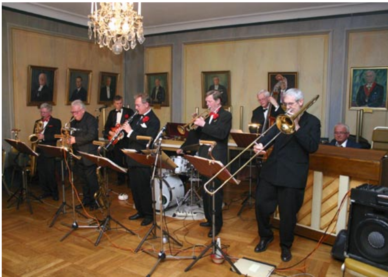
Kvällen avslutades med dans till mycket uppskattade Steamboat Saloon Orchestra