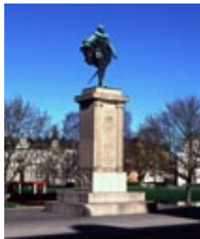
OMSLAGSBILDEN Christian Erikssons skulptur av Karl IX i Residensparken