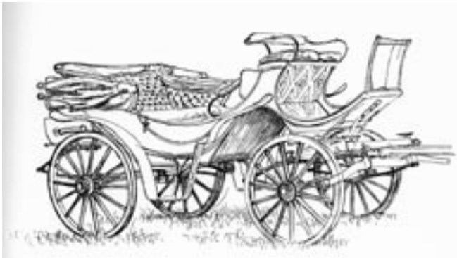
Inledningsvis tillverkades vagnar av olika slag. Bilden visar en promenadvagn – en fransk Viktoria