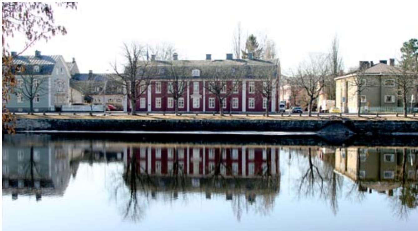
Grevgården vid Klarälvens vatten