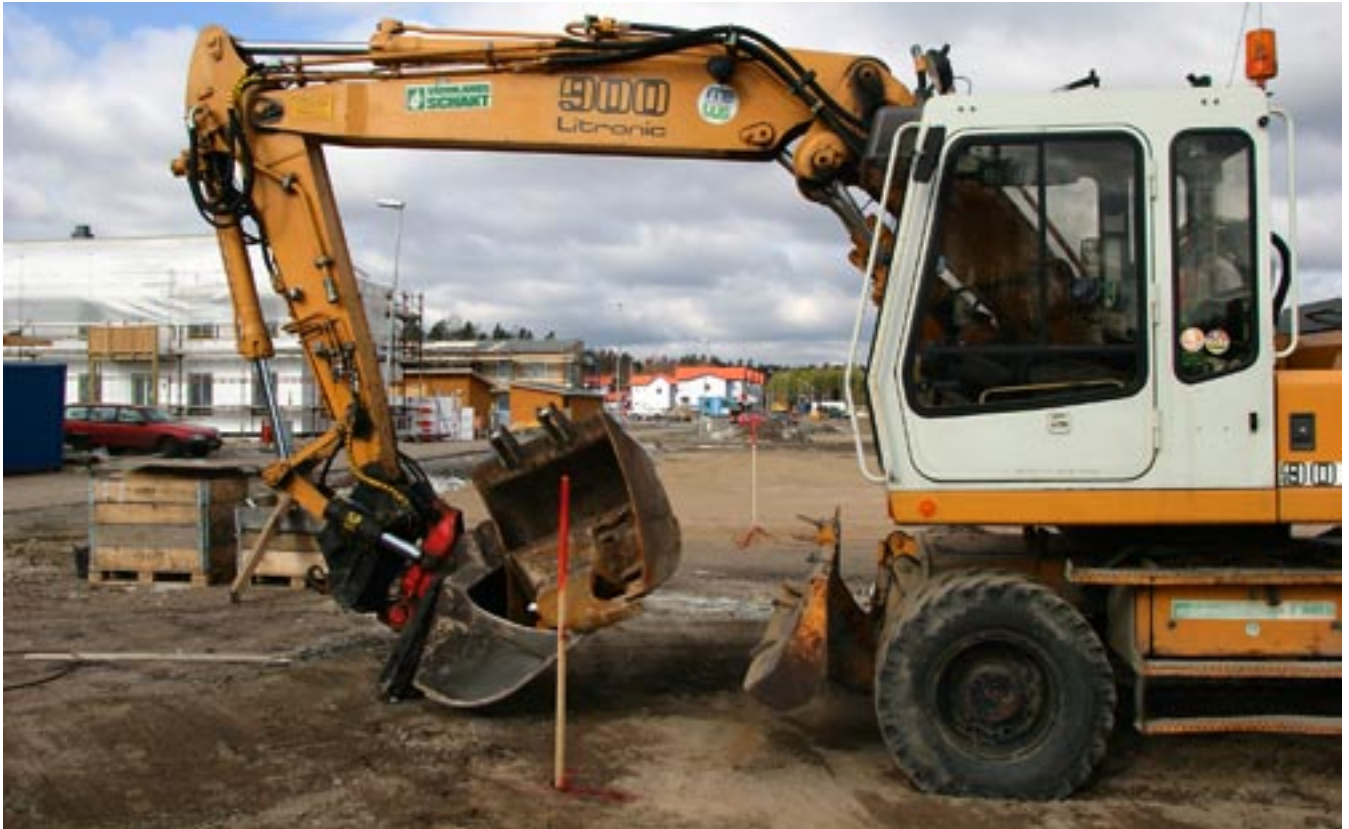
Målsättningen är att bygga 1 000 nya lägenheter per år i Karlstad. På bilden är arbetena i full gång i Södra Råtorpsområdet, där de första hyresgästerna redan flyttat in

måste vi slå vakt om den unika miljön i Sveriges största deltaområde. Delar av våtmarkerna i Klarälvens mynning och närheten till Vänern måste värnas för att erbjuda karlstadsborna möjlighet att skapa sig en rik fritid genom att nå vattnet. Också ur turistisk synpunkt är det värdefullt med vattnet. Redan i dag besöks Klarälvsdeltat av fiskeentusiaster från flera andra länder.