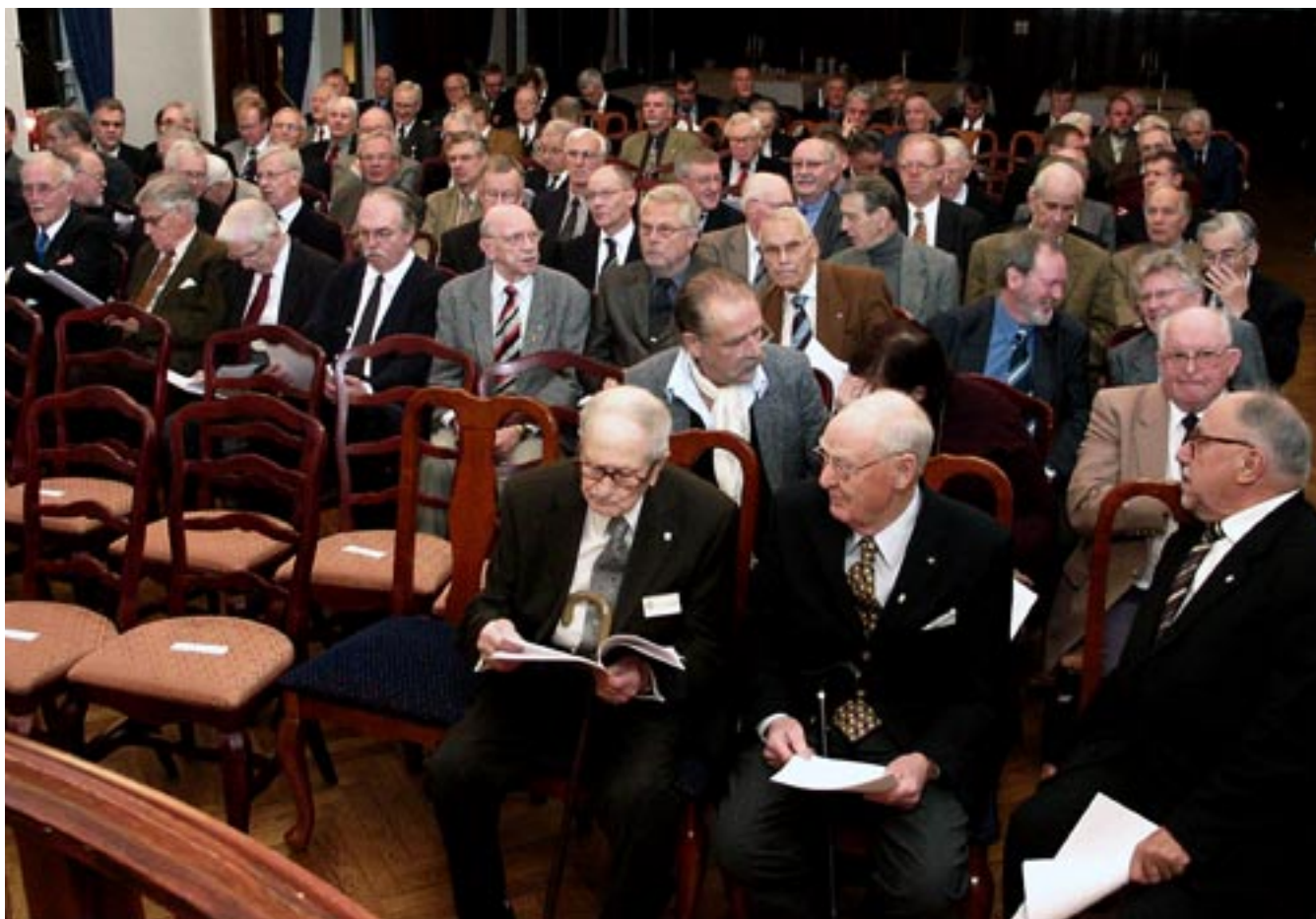
Höstgillet 2003 samlade nästan 140 medlemmar med många kända namn