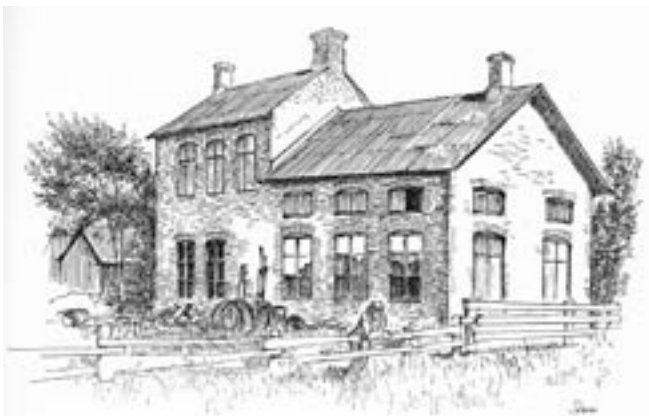
År 1894 byggdes gjuteriet i Viken.