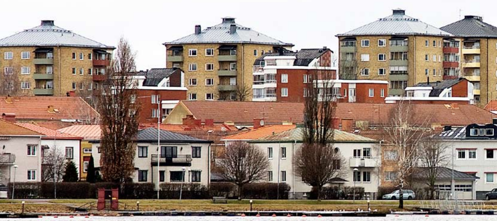
Vy mot Kvarnberget från Orrholmen

att investeringar i skolor och andra komplement, som ofta finns i villaområdena, utnyttjas på rätt sätt. Det behöver byggas bostäder i centrala delar av städerna för att få attraktiva lägen med gångavstånd till det mesta. Genom en förtätning i centrala delar kan man, förutom att bilen används mindre, även utnyttja redan befintlig infrastruktur och därmed göra miljövinst. Men förtätningen måste göras med finesse! Man måste lära av tidigare misstag och inte förtäta till varje pris utan på byggnadens eller områdets villkor.