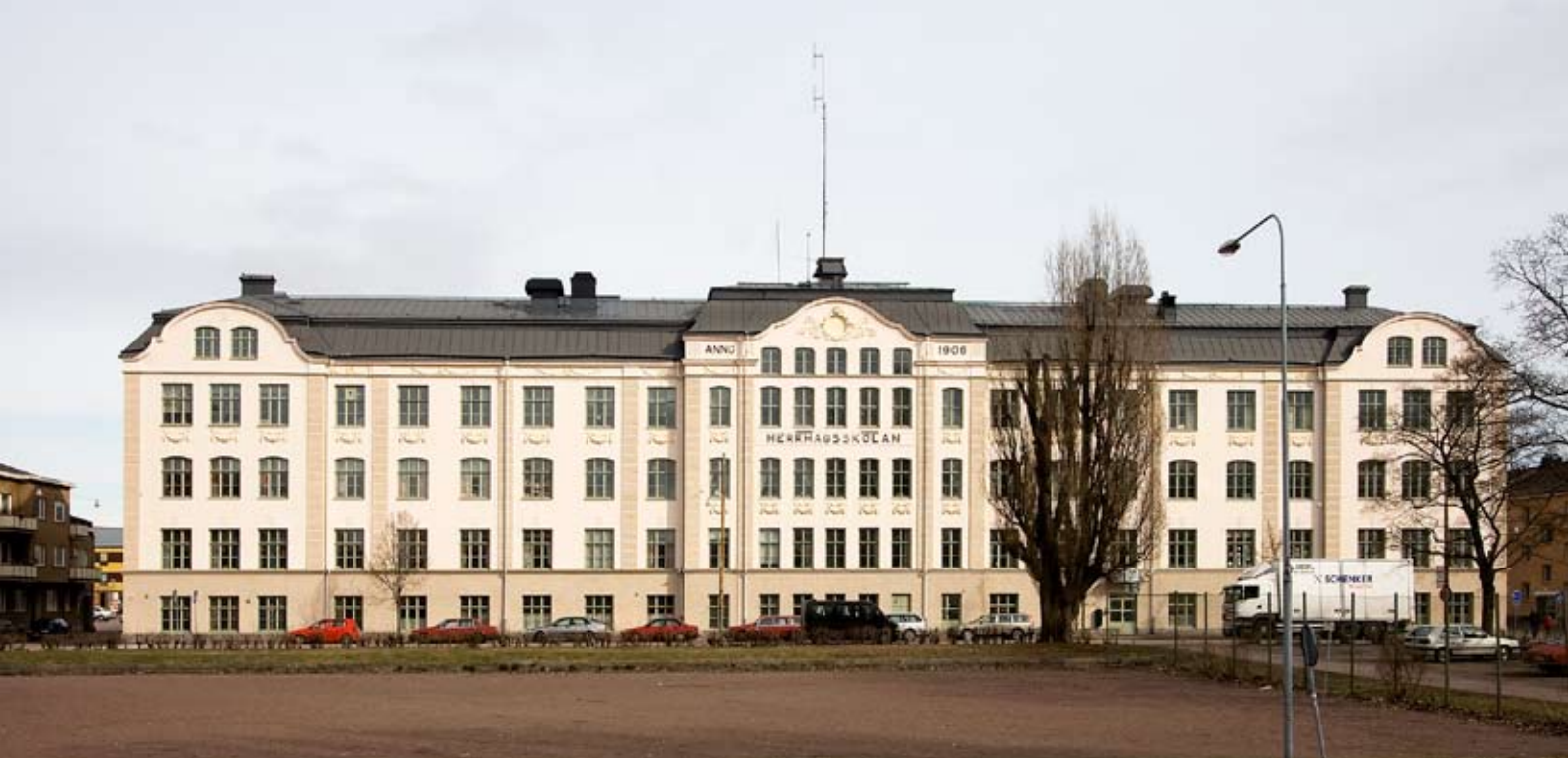
Herrhagsskolan som den ser ut 2007