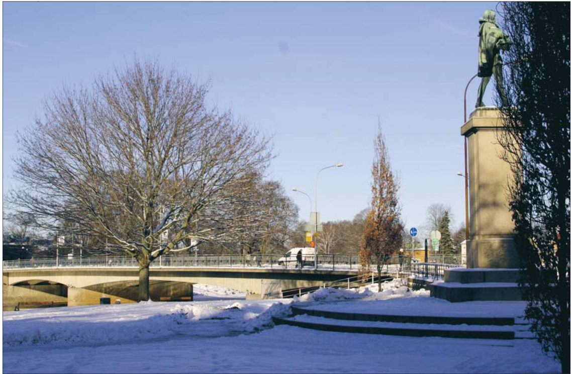
VÄSTRA BRON. Det här bygget kom till 1944 men här har det funnits en bro redan innan Karlstad blev en stad, 1584.

ANNO 1696. Så här skissades Karlstad upp för över 300 år sedan. Då hade staden bara två träbroar över älven och den östra ser ut att ligga ännu mer österut än dagens stenbro.