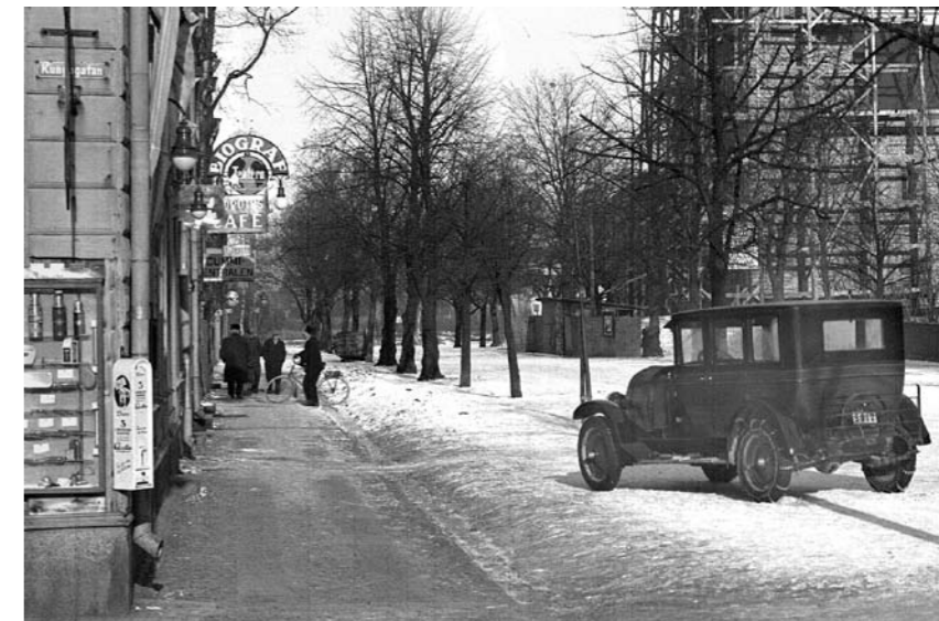
Biografteatern låg på Östra Torggatan 15.

dragandes i ett snöre, medan solens varma strålar smeker kroppen, är heller ingen dum sport.