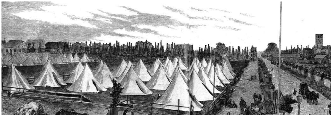
Av stadens 241 tomter var endast nio obrända. Branden pågick med våldsamt kraft i 16 timmar