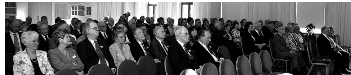
Cirka 130 medlemmar hade anmält sig till vårgillet

Vid vårgillet framfördes önskemål om att äldermannens värddikt skulle få komma med i tidningen. Här är den.