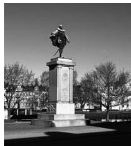
OMSLAGSBILDEN Christian Erikssons skulptur av Karl IX i Residensparken

Vid vårgillet den 20 april 2006 beslutades att medlemsavgiften för år 2006/2007 skall vara oförändrad 175 kronor av vilka 25 kronor avsätts till Carlstads-Gillet litteraturfond.