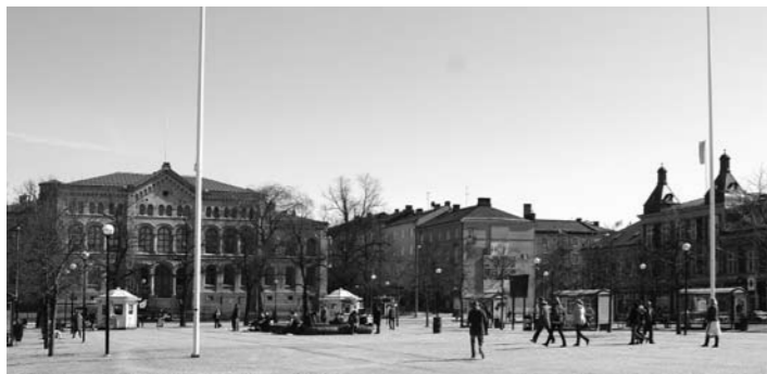
Stora torget mot öster med Brända tomten mellan Tingvallagymnasiet och Bergqvists skoaffär