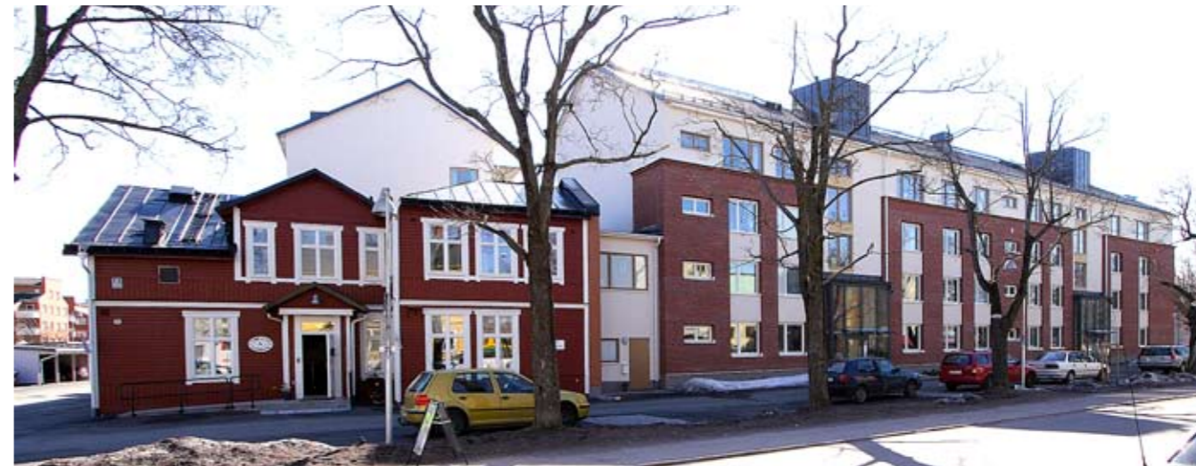
Den gamla kontorslokalen från Wennbergsepoken är kopplad till det nybyggda bostadshuset i Viken