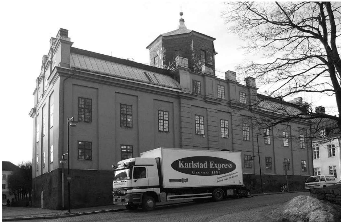
Efter restaureringen av Gamla gymnasiet finns endast en arkitektbyrå och Skolmuseet kvar i huset. Hembygdsförbundet, Hembygdsföreningen, Läroverkets kamratförening och Carlstads-Gillet har flyttat till andra lokaler.

Genom att i fortsättningen delar av Carlstads-Gilletts tillhörigheter finns i Värmlands Museum och Värmlandsarkiv blir de mer synliga för allmänheten.