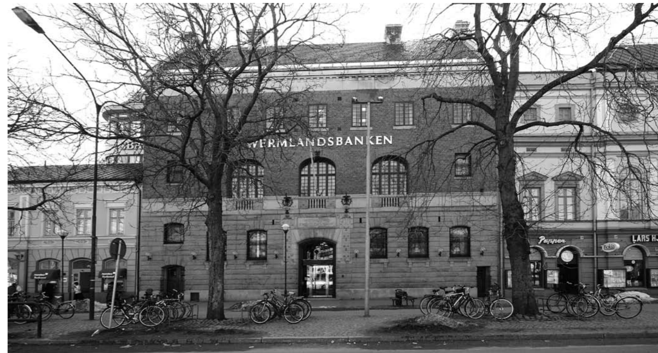
Gamla Wermlandsbankens pampiga byggnad i nationalromantisk stil

våningen. En idé var då att Carlstads-Gillet tillsammans med Karlstads Hembygdsförening och Värmlands Hembygdsförbund gemensamt i ett handelsbolag skulle finansiera sin verksamhet genom att hyra ut den så kallade prästamötessalen som mötes- och konferanslokal. Emellertid kunde inte denna tanke realiseras eftersom inga ingrepp fick göras i den värdefulla kulturbyggnaden och en offentlig lokal måste bland annat ha reservutgång och vara handikapp-anpassad.