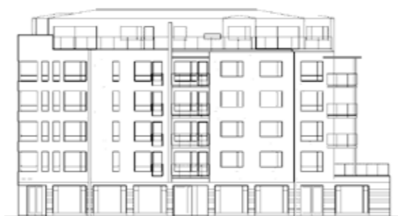
Nybyggnad på Brända tomten mot Östra torggatan enligt arkitektfirman Bergfjord & Ivarssons ritning

Under den här rubriken tar vi upp bebyggelseutvecklingen i staden. Det som byggs i dag är historia i morgon!