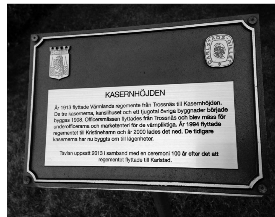
Upplysningstavlan avtäcktes i samband med en minnesceremoni på Kasernhöjden den 31 augusti.