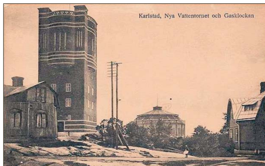
Karlstad, Nya Vattentornet och Gasklockan