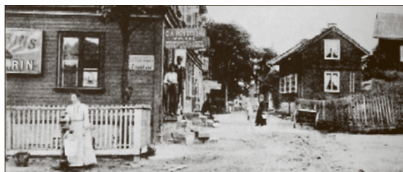
KARLSTADS MONTMARTRE. Mångas hus på Kvarnberget byggdes raskt upp efter branden 1865 då många behövde nya bostäder snabbt. De kom att ligga huller om buller och här ser ni den blivande Kvarnbergsgatan fotograferad från järnvägsövergången vid Klaraborg 1906.