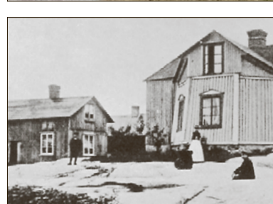
KVARNRESTER. Det ljusa boningshuset i mitten på bilden är vinklat nedtill och är resterna av Kvarnbergets sista kvarn. Foto: MATS RONGES "DET GAMLA CARLSTAD"