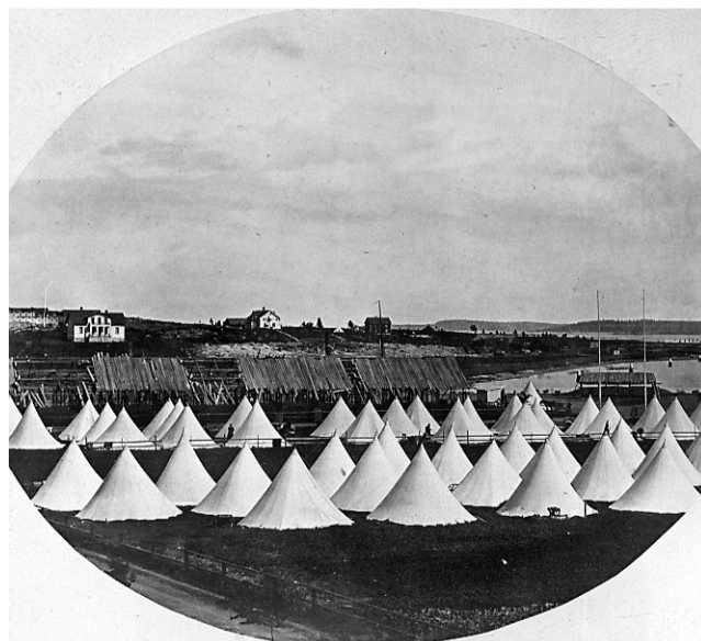
Tältlägret vid Inre hamn med Herrhagen i bakgrunden. Efter branden hade i stort sett alla 5 000 Karlstadsbor förlorat sina hem.