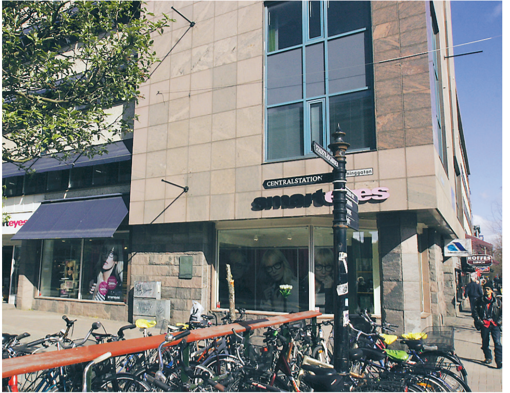
Här i korsningen Östra Torggatan/Drottninggatan gick Skepparegatan. Står man längst in i butiken Lagerhaus på Drottninggatan befinner man sig mycket nära platsen där branden startade för 150 år sedan, i bageriet på dåvarande Skepparegatan.