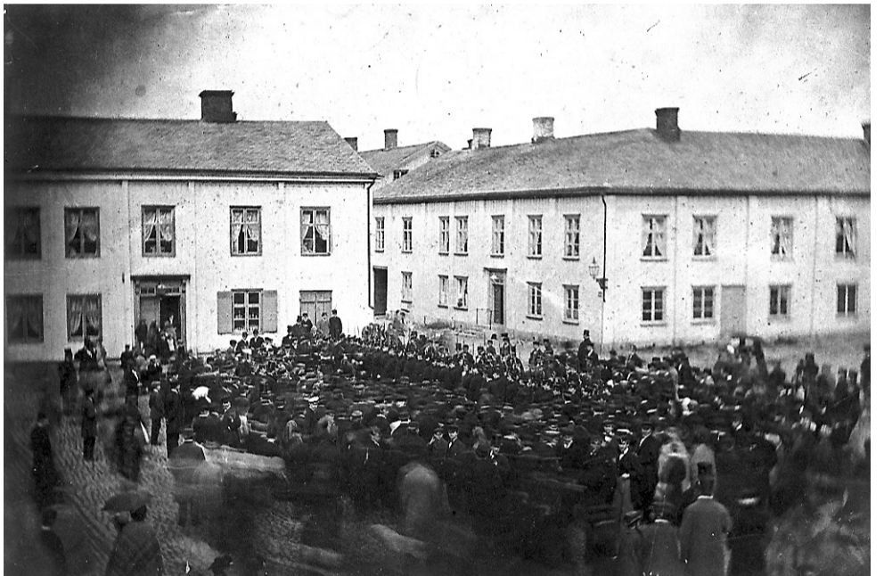
Bilden visar norra delen av Stora torget 1863, två år före branden. Då var torget betydligt mindre än vad det kom att bli vid återuppbyggnaden av staden.