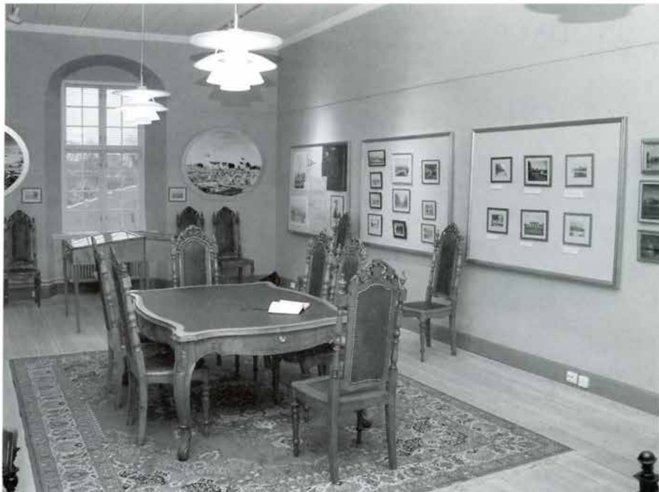
Det pompiga sammanträdesrummet med Carlstads-Gilletts eleganta möbelgrupp i centrum.