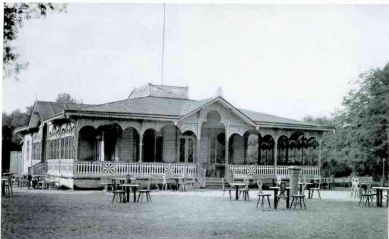
Den första restaurangen i sin ursprungliga skepnad. Fotot taget någon gång före år 1885.

Stadsträdgården är och har under en lång följd av år varit en omtyckt oas för Karlstads invånare, och restaurangen, som fanns ända till 1959, har bidragit till dess popularitet.