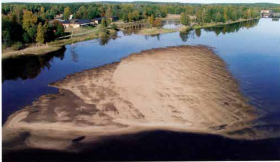
Den stora sandbanken i Klarälven norr om Sandgrundsudden fotograferad den 2 oktober 2002