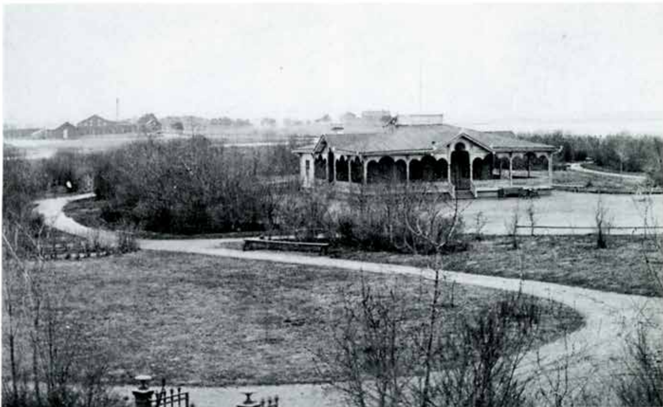
Den första restaurangen med den ursprungliga S-formade gången från entrén vid Expositionshuset. Lägg märke till Orrholmens sågverk och arbetarbostäder i bakgrunden.