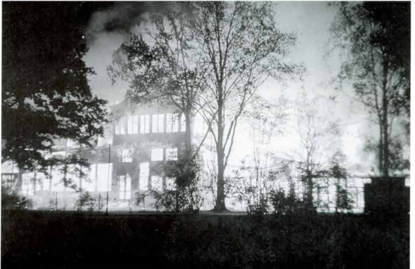
Slutet på en 59-årig bana den 17 september år 1959.

framför allt från besökare, både Karlstadsbor och turister: "Varför har inte denna stora fina park med sin attraktionskraft, en stadens lunga och plats för rekreation, någon form av sommarkafé eller servering? Vore inte detta någonting att åter satsa på?"