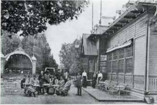
Den andra restaurangen i ursprungligt skick utan veranda. Till vänster i bilden syns den år 1893 byggda musikpaviljongen. Militärerna, förmodligen musiker, intar förfriskning före en konsert