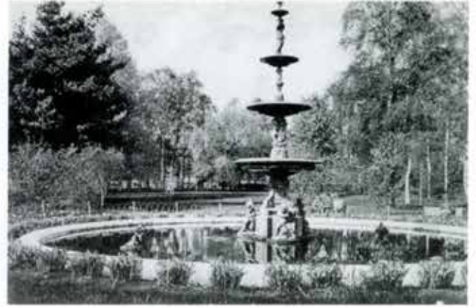
Bolinder-fontänen från år 1897 sedd mot väster. Lägg märke till den dåtida mycket lummiga omgivningen i parken

Någon ny restaurang byggdes aldrig i Stadsträdgården, det blev Sandgrund i stället. På senare år, när nu den vackra parken åter har blivit istandsatt till i stort sett sitt gamla lummiga utseende, planterad med blommor, buskar och träd, har många röster framförts,