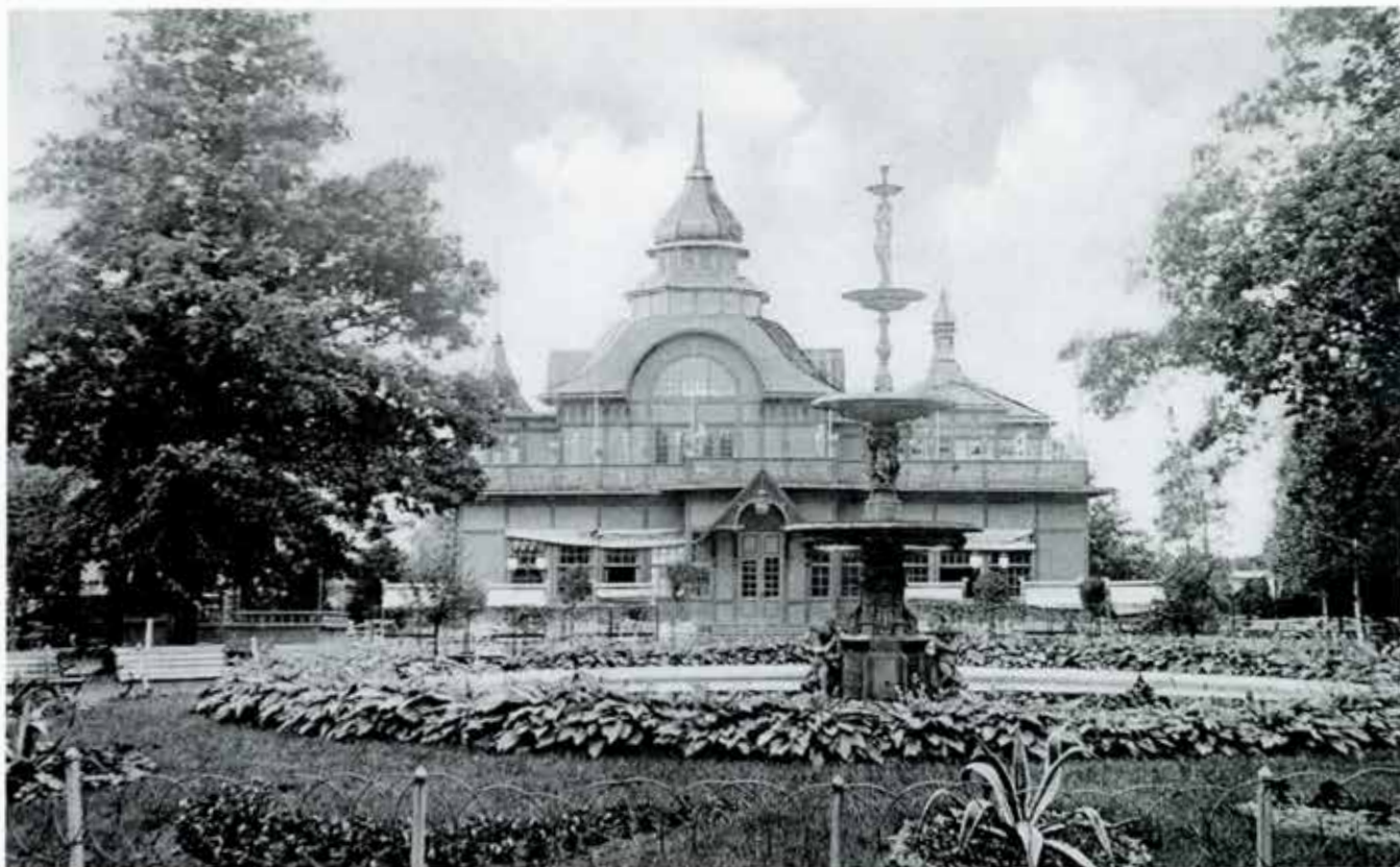
Den andra restaurangen i ursprunglig skepnad före 1930 års stora renovering av exteriör och interiör.