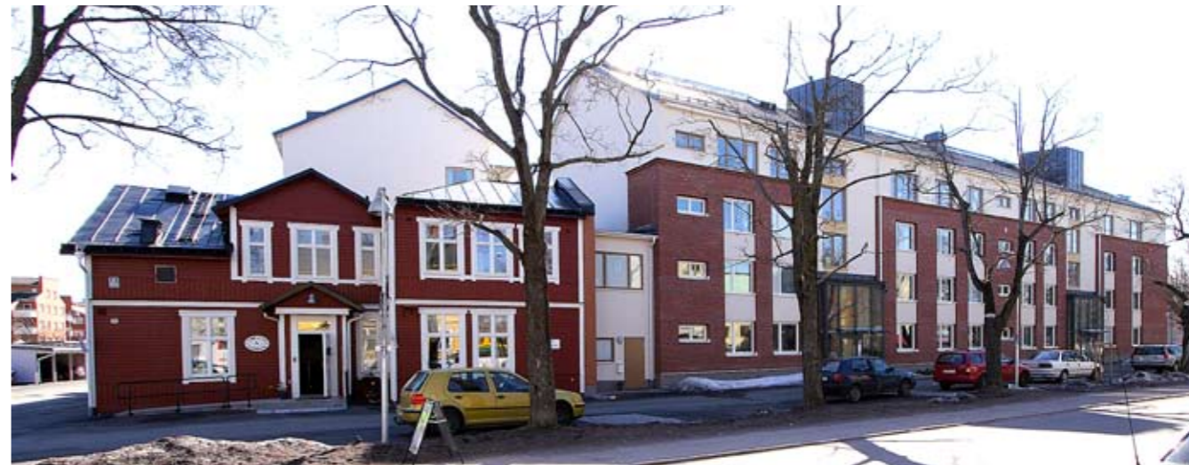
Den gamla kontorslokalen från Wennbergsepoken är kopplad till det nybyggda bostadshuset i Viken

i stadsdelen Viken. Det är den gamla fabriksfastigheten, som varit bebyggd med en industribyggnad och som uppfördes för C J Wennbergs mekaniska verkstad år 1894, som nu har fått en ny funktion. I Gillets tidning från 2004 beskrivs industrin.