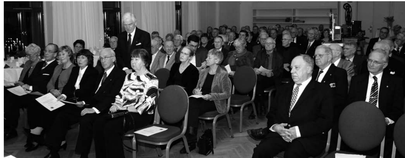
Ett hundrafyrtiotal medlemmar hade mött upp till höstgillet 2005