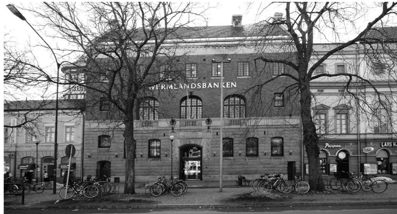
Gamla Wermlandsbankens pampiga byggnad i nationalromantisk stil

våningen. En idé var då att Carlstads-Gillet tillsammans med Karlstads Hembygdsförening och Värmlands Hembygdsförbund gemensamt i ett handelsbolag skulle finansiera sin verksamhet genom att hyra ut den så kallade prästamötessalen som mötes- och konferanslokal. Emellertid kunde inte denna tanke realiseras eftersom inga ingrepp fick göras i den värdefulla kulturbyggnaden och en offentlig lokal måste bland annat ha reservutgång och vara handikapp-anpassad.